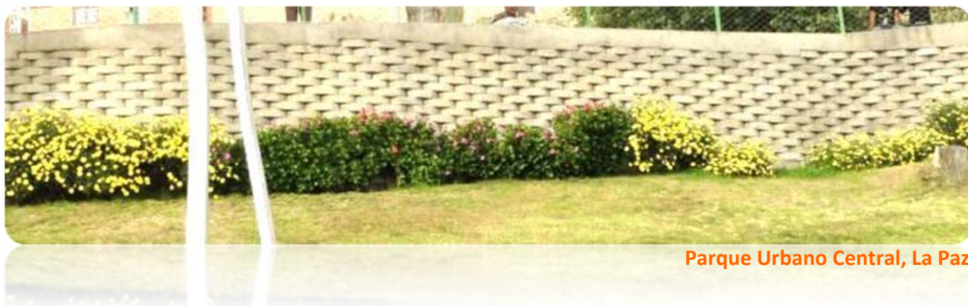
Parque Urbano Central, La Paz

Las piezas de Ecomuro deben ser colocados de manera que se tenga una coincidencia en los orificios de las piezas de diferentes niveles, por estos orificios deben pasar fierros de armadura que deberán estar anclados a una base, preferentemente de concreto vaciado. Los fierros deben ir desde la base hasta la parte superior de la altura total del muro. Se debe rellenar los orificios con un mortero resistente, de manera que el acero tenga el revestimiento correspondiente.